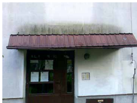
Docieplona elewacja systemem BSO z tynkiem bez wapna. Wygląd po 8 latach

Uważam, że czynnikiem najbardziej destrukcyjnym i degradującym budowlę jest woda. Dotyczy to nie tylko fundamentów, ale również tynków. Wszędzie tam, gdzie są one wystawione na długotrwałe oddziaływanie wilgoci, z czasem mogą pojawić się także grzyby i glony. Dlatego powinniśmy zadbać o takie