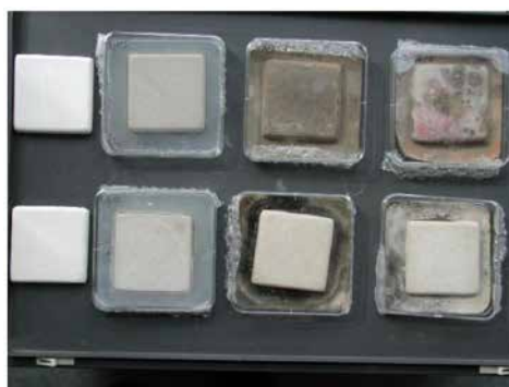
Porównanie oddziaływania grzybów na podłoże z wapnem (na dole) i bez wapna (na górze)